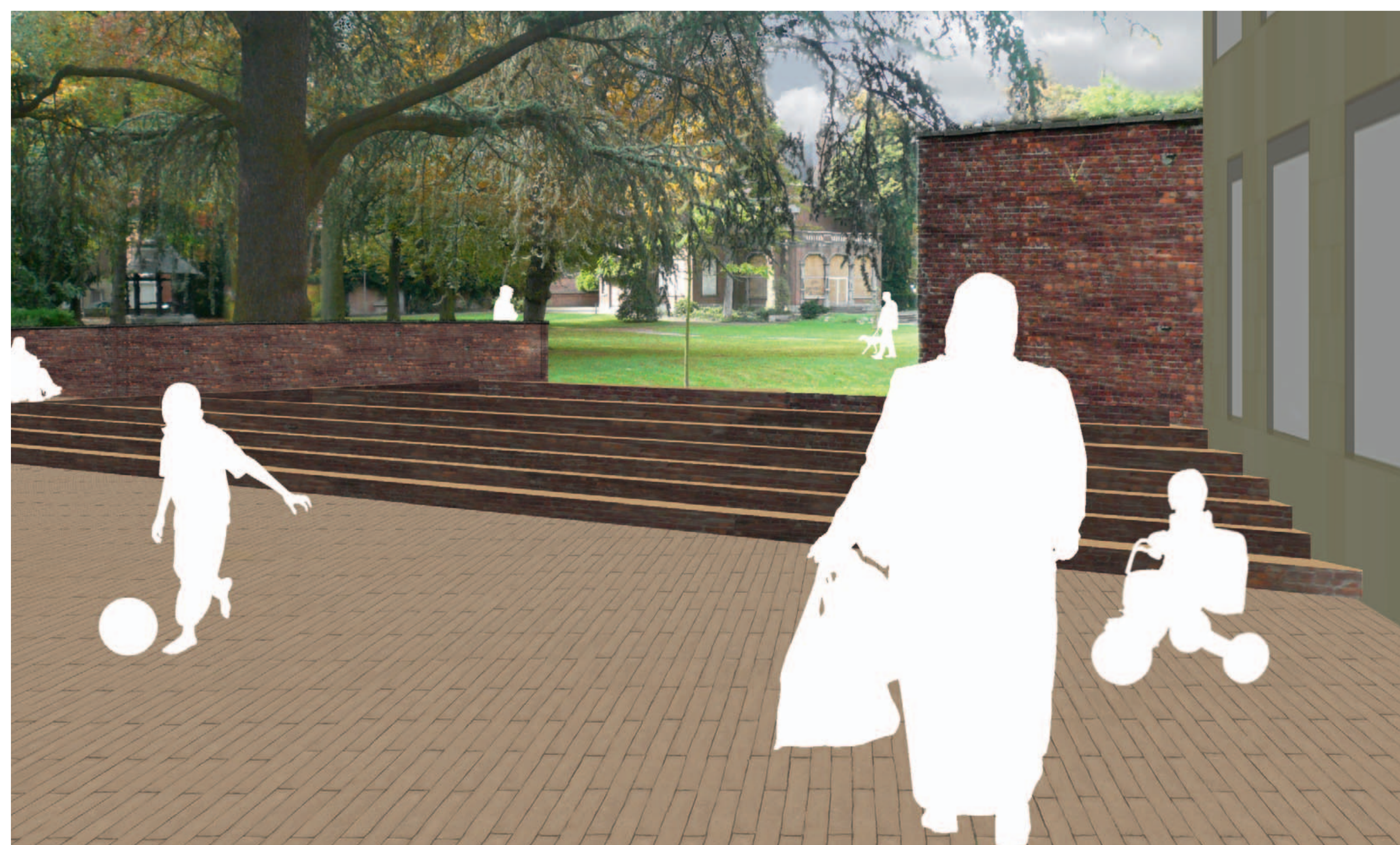
Impressie van de doorsteek vanuit parking supermarkt naar Gravenhof

Het Gravenhof is één van de verschillende hoven of voormalige kasteeldomeinen die Hoboken rijk is. Het was oorspronkelijk een privaat domein. Dit kunt u nog duidelijk zien aan de restanten van de muur die het hof omrandde. Nu is het een publiek park, maar het park zit te veel verstopt in het bouwblok. Het masterplan formuleert enkele mogelijkheden om dit te verbeteren. Om de Kioskplaats direct met het park Gravenhof te verbinden, stelt het plan voor een toegang tot het park te creëren van de parking van de supermarkt Carrefour, gecombineerd met een verbetering van de doorsteek tussen deze parking en de Kioskplaats. Zo creëer je met een ook een fiets- en wandelweg in het groen van het centrum naar de nieuwe wijk Groen Zuid.