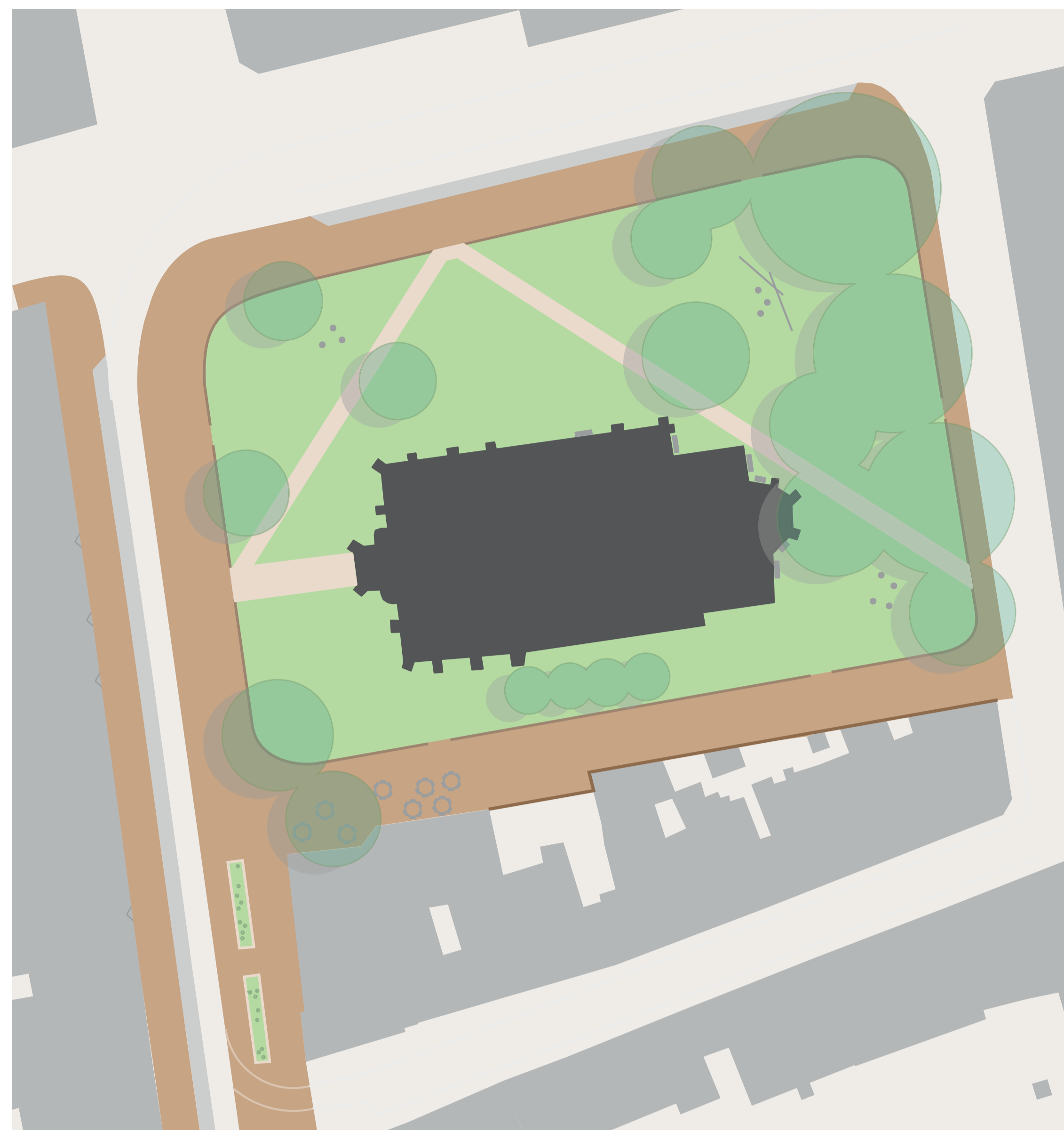
Een ontwerp van de kerk en omgeving