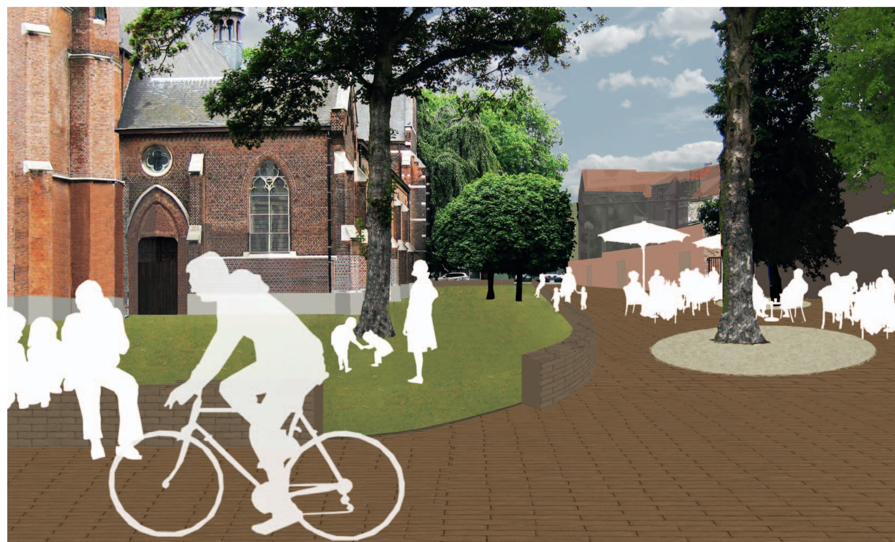
Impressie van hoe de ruimte van de kerk deel kan uitmaken van het centrum

De kerk bevindt zich op het kruispunt tussen de Antwerpsesteenweg en de Kioskplaats. Het is een markante plek die de aanzet van het centrum van Hoboken markeert in het noorden. De tramstop, de geparkeerde wagens, het hek, de beplantingsstructuur versterken de barrière tussen de omgeving van de kerk en de Kioskplaats. Het algemeen uitgangspunt is om de omgeving rond de kerk en de kerk te betrekken op de centrale ruimte van de Kioskplaats. Door de rand mee op te nemen in de publieke ruimte wordt het een deel van de centrumfiguur en is het niet langer een eiland. Door aangepaste verlichting en ruimte voor een terras wordt het een kwalitatieve ruimte.